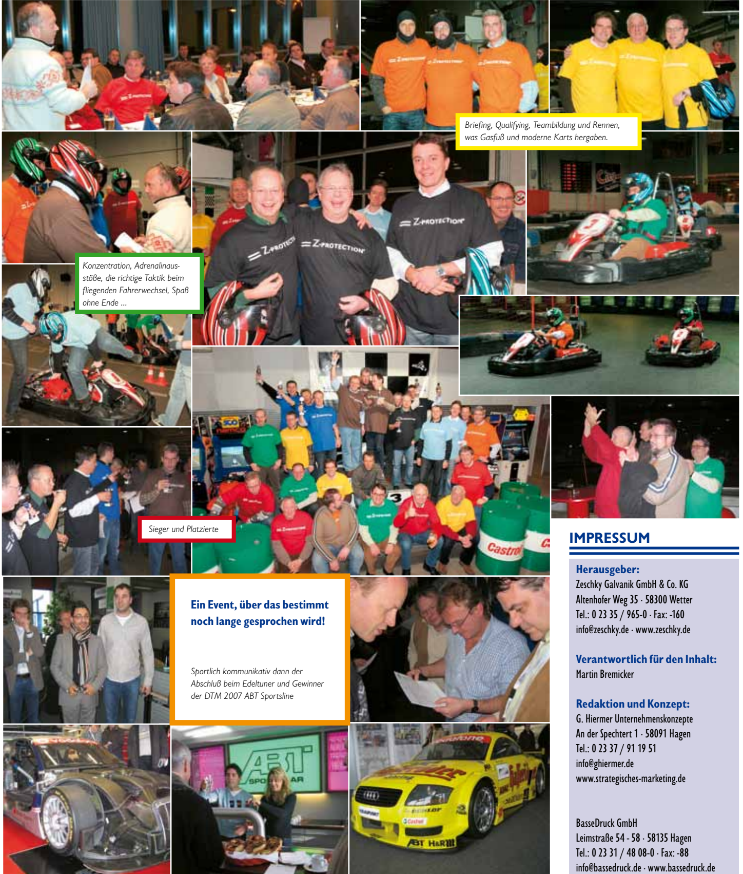
Briefing, Qualifying, Teambuilding und Rennen, was Gasfuß und moderne Karts hergaben.

Nach Oberflächentechnik, technisch aktuell und zukunftsorientiert diskutiert, Themen wie kundenindividuelle Dienstleistungen, Prozessabläufe, logistische Besonderheiten und das, was in Klein- und Kleinstgruppen, in Kommunikationspausen besprochen wurde – ein toller Abend in bzw. auf der Allgäuer Hallenkartbahn.