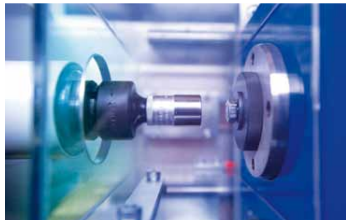
Neue Prüfeinrichtung zur Bestimmung von Reibbeiwerten

Das ist das Entscheidende! Denn die von Zeschky beschichteten Schrauben werden automatisch weiterverarbeitet. Nur höchste Qualität sorgt auch hier für zufriedene Kunden.