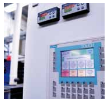
Diverse Prüfungsvorgänge: Korrosionsbeständigkeit, Schichtdickenmessung, Reibwertermittlung zur Qualitätssicherung